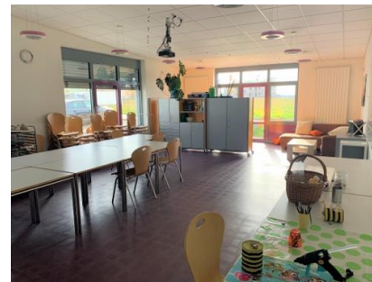
Lernstudio mit Sitz- und Musikecke